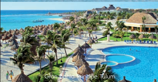
Grand Bahia Principe Tulum