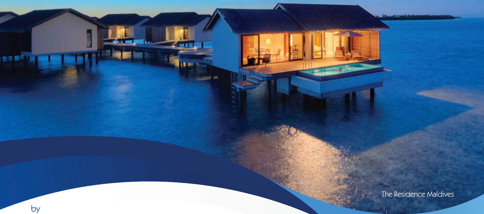
The Residence Maldives