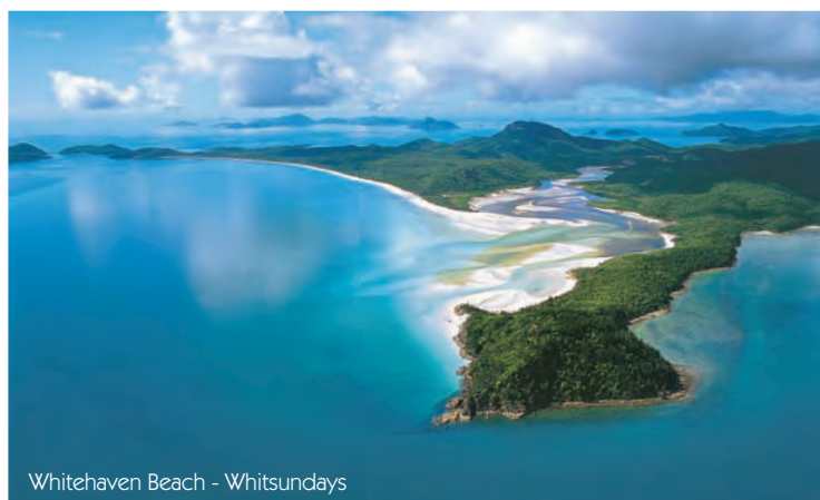
Whitehaven Beach - Whitsundays

Si può chiamare in Italia pagando con carta di credito, carta telefonica prepagata oppure addebitare la chiamata al ricevente tramite operatore. Per chiamare in Italia con telefoni cellulari è indispensabile avere un telefono compatibile con gli standard locali, ma la copertura non è sempre garantita. Prefisso per l'Italia: 0039 - Prefisso dall'Italia: 00679. Si riescono a trovare diversi internet point nei centri abitati. In ogni città ed in tutti gli hotel potrete controllare e-mail e navigare senza problemi, e nei migliori alberghi addirittura via wireless.